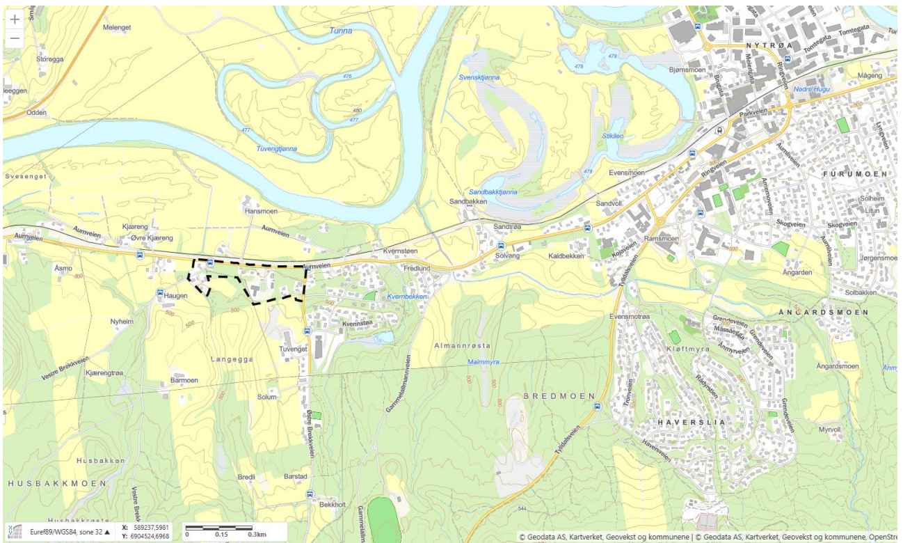
Figur 1: Oversiktsskildring