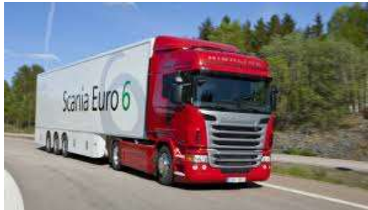
Euro6 – kutter partikkelutslipp