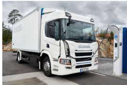
Elektrisk lastebil – kutter utslipp av CO2